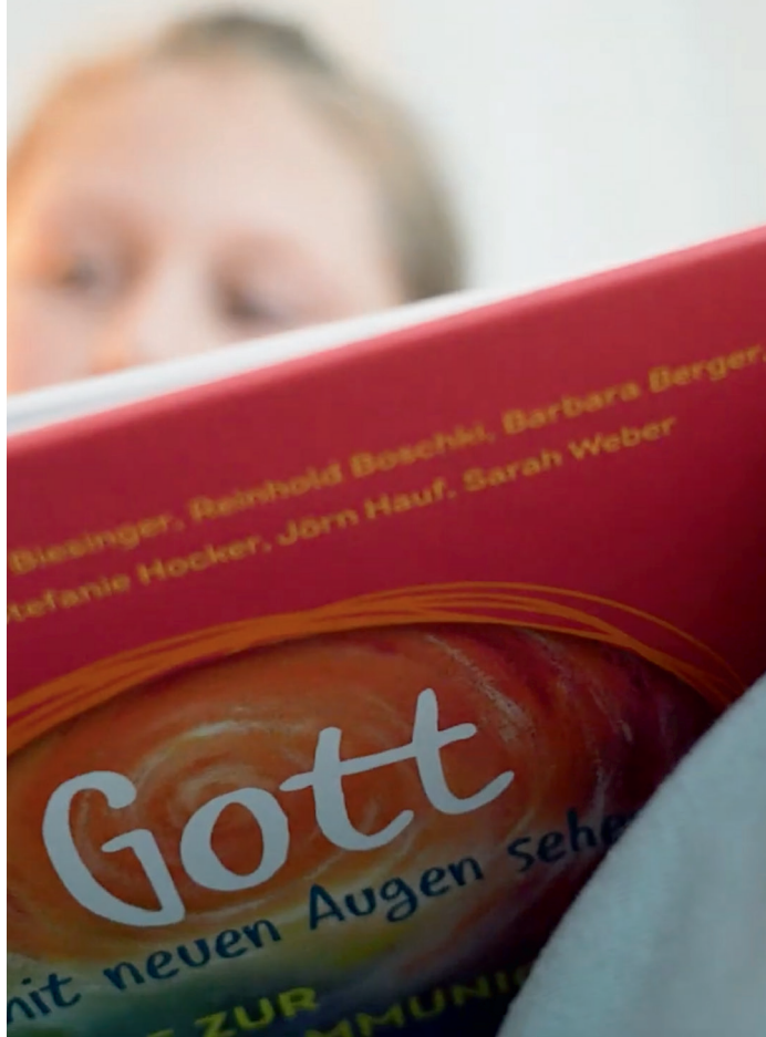
Vorbereitung auf die Erstkommunion