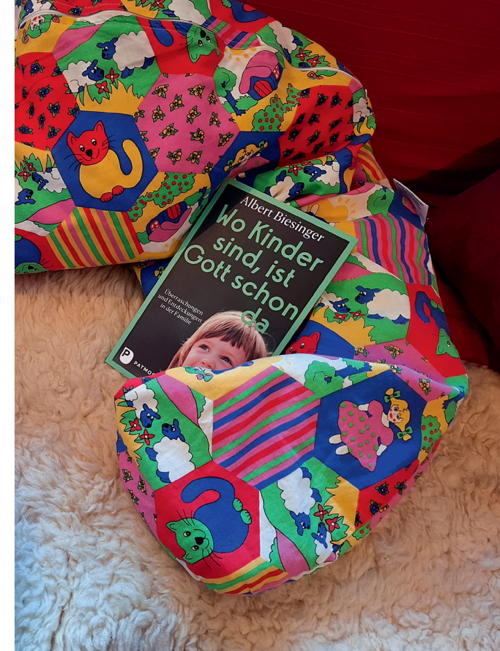
Kinder ermöglichen Gottesberührungen in der Familie