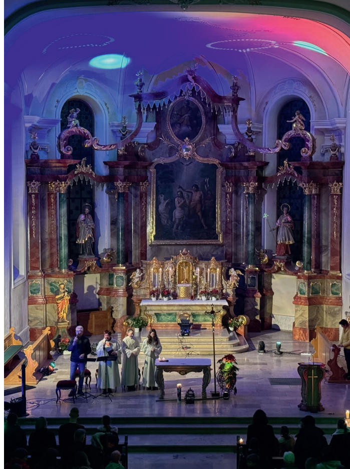
Die Musikkirche Rust lädt zur Lichtershow

© aus dem Film „Gott mit neuen Augen sehen“, produziert von Julian Gräfe